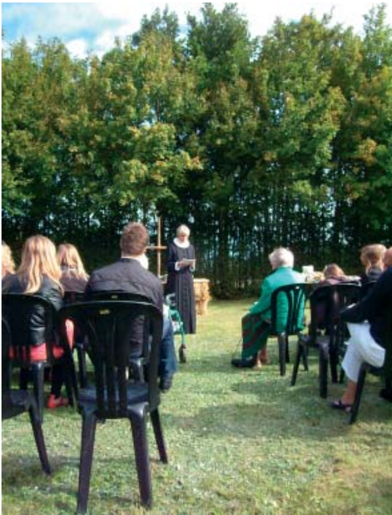
Gudstjeneste i det grønne. Vi sidder på klapstole, alteret er lavet af halmballer, og salmebøger, dåbsfad, brød og vin er taget med udenfor til 'rullende' altergang.