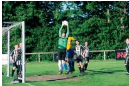
Her er ABBs yngste oldboyshold i hjemmekamp.