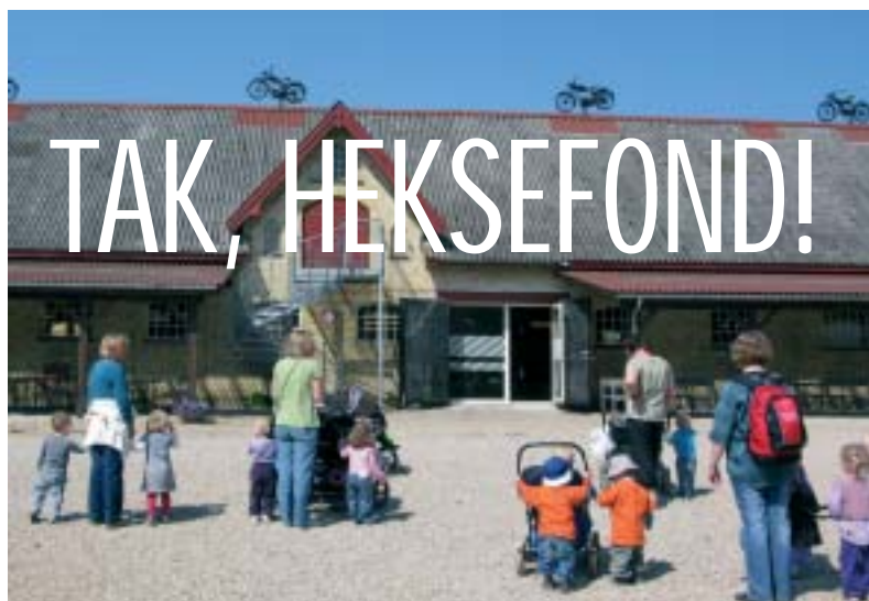
25 børn, 7 dagplejere og 3 hjælpere var på Egeskov Slot for Heksefonden-midler.