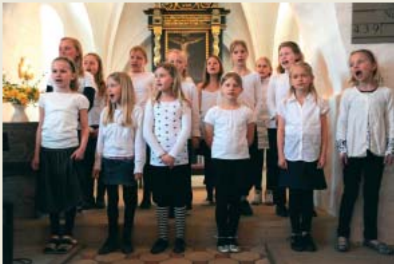
Børnekoret - arkivfoto fra 2009.

Kun hvis du er syg eller forhindret af vigtige årsager, kan du være fraværende.