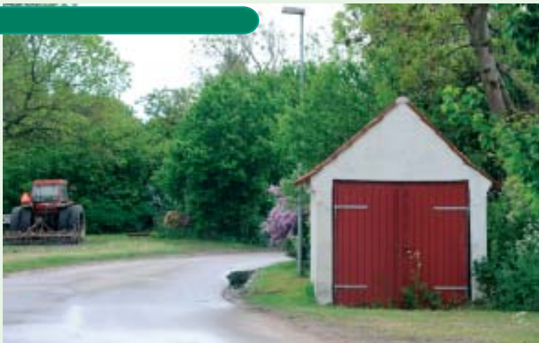
Sprøjtehuset i Vester Kærby, som oprindeligt er fra 1866. Godsejerne var dengang forpligtet til at holde sprøjte- og slukningsredskaber i landsbyerne.

sogneforstanderskab modtog eksempelvis materiale fra to sprøjtefabrikanter i København og en enkelt i Odense. I fortegnelsen over de 33 fynske sprøjtehus står der, hvornår hvert enkelt er taget i brug. Vester Kærby sprøjtehus er fra 1866.