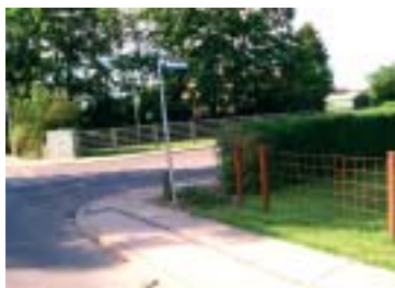
Snarrådig borger fjernede 3 planter.

Der har i flere år været en dårlig oversigt ved hjørnet, så man skulle langt frem for at holde øje med trafikken fra venstre. Beboeren på hjørnet har nu fulgt en opfordring til at skære lidt af hækens top ved helt at fjerne nogle hækplanter og skåret hjørnet skråt af, og voila så