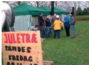
Julebanden samlet ved butikstorvet.

Træet havde godt nok svært ved at konkurrere med de mange private juletræer i vor landsby, men det havde den fordel, at det lyste op på den mør-