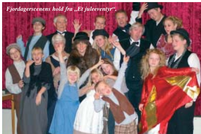
Fjordagerscenens hold fra „Et juleeventyr“.

Hele Brugsen summede den dag af jul. Ud over julemusikken var der smagsprøver og servering af julegløgg.