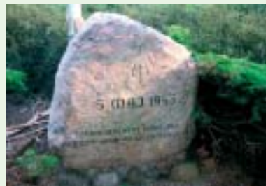
Lotterne rejste denne mindesten.