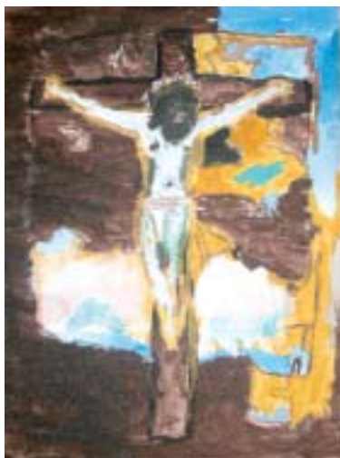
Ikoner malet af én af årets konfirmander.

Ikoner malet af årets konfirmander kan ses ved ferniseringen i Sognegården umiddelbart efter familiegudstjenesten Palmesøndags d. 5. april kl. 11.00 i Agedrup Kirke - (Påsken 2009 omtales i næste nummer af A.R.).