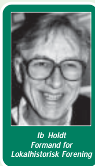
Ib Holdt Formand for Lokalhistorisk Forening

I 25 år derefter samledes beboere fra sognet ved stenen sammen med