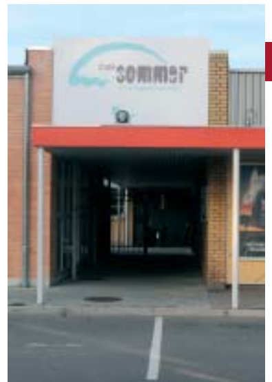
Sommer stopper 1. nov. som forpagter.

Det vil være trist, hvis caféen lukker helt, så lad os håbe, at anpartsselskabet, der ejer ejendommen, finder en ny forpagter, og caféen dermed kan køre videre.