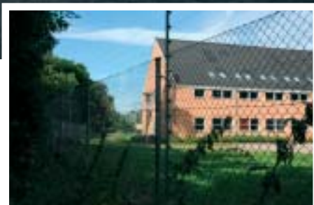
Sydfløjen, der i dag står ledig.

Al-Salahiyah Skolen er en dansk friskole, hvor alle elever har anden etnisk baggrund end dansk. Der er elever af ni nationaliteter, og der undervises i modersmålsundervisning to