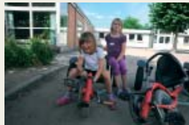
Nogle børn startede allerede 1. august i skolefritidsordningen.

rien været i gang med at få lavet materialer til en lukket bandebane i skolegården og er i skrivende stund godt på vej med arbejdet med at sætte den op. Da der er en del støbearbejde for-