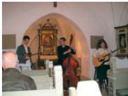
Mange gik glip af Duo Kontrabas