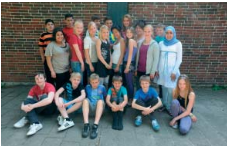
7. b. - Heller ikke her skal alle konfirmeres.