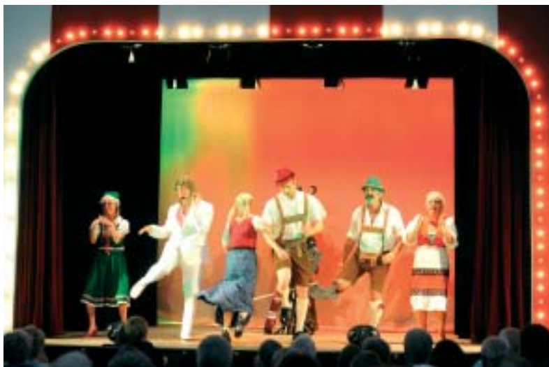
„Der Hansi“ bakkes dygtigt op af landsmænd i et forrygende godt nummer.