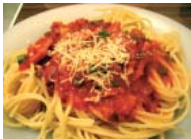
Børnegudstjeneste med aftensmad.

Et helt nyt tiltag vil være Gud og spaghetti . Den måske tankevækkende betegnelsen dækker blot over en kort børnegudstjeneste i kirken med efterfølgende fællesspisning i Sognegården kl. 17.00 - ca.18.30.