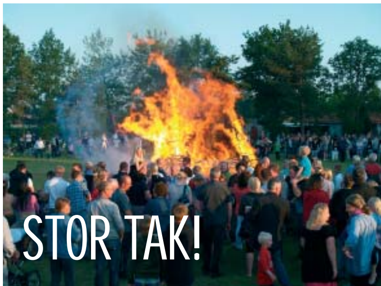
Mere end 20 ildsjæle medvirker til forberedelsen af Skt. Hansfesten.

Af Hans Jørgen Zinther, fmd. Heksefonden