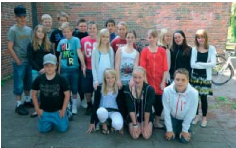
7. a. - Ikke alle skal dog konfirmeres, men for dem, der skal, begynder forberedelserne onsdag den 15. september i Sognegården..