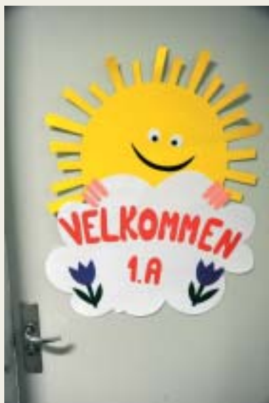
Varm velkomst til de små.

i skolefritidsordningen fra 1. august, og det har en pæn del af dem benyttet sig af. Det giver en god stemning, når vi starter på kontoret, at der er en lydkulisse med glade, legende børn. Det giver børnene en enestående mulighed for at lære skolen at kende og blive fortrolige med omgivelserne, inden alle eleverne fylder lokalerne.