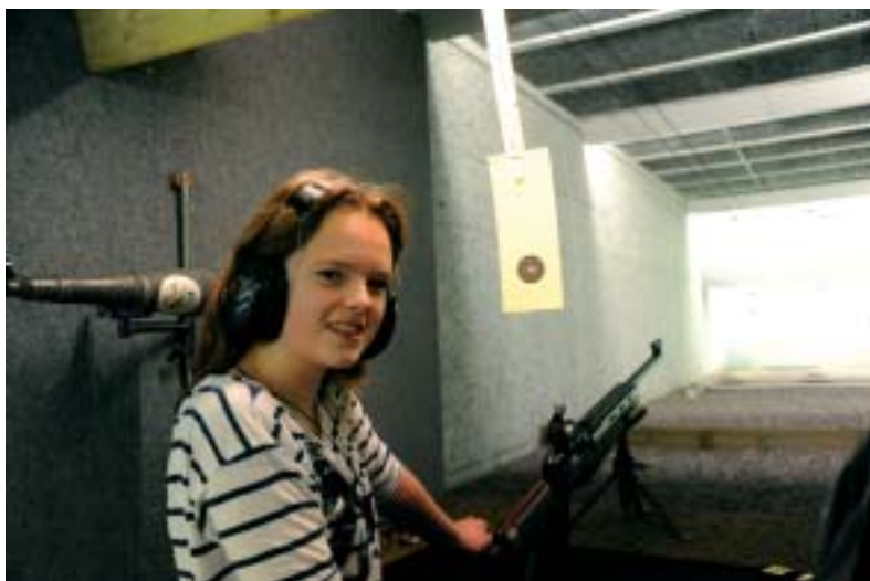
6. b's skyttedronning ved Skyttehusets 25 m -bane.

Så hold godt øje med skiltningen! Benyt én af de 48 afmærkede pladser og undgå en parkeringsafgift.