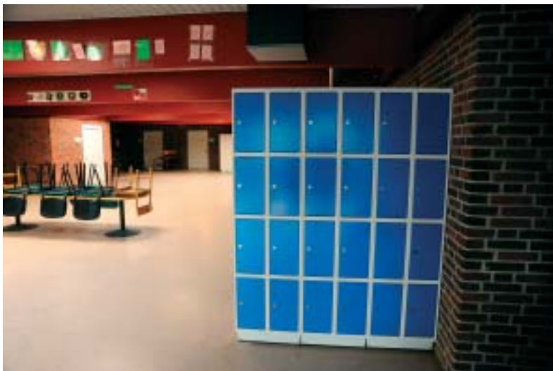
I Fællesrum Nord kan alle eleverne i overbygningen nu få et aflåst skab til rådighed.